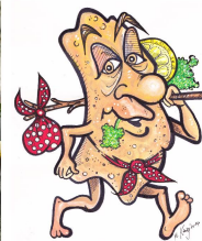
Schnitzel to go ;-)